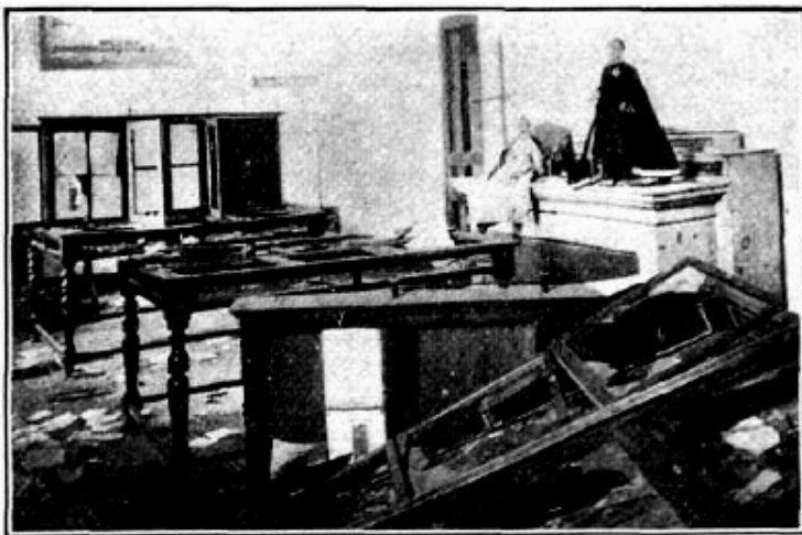
¿Cómo quedó el museo de la cárcel, después de la revuelta de los presos.

Con Amaya destituido, se produjo el cese del motín. Uno de los lugares más afectados fue el museo penitenciario (imagen 2), de donde los presos sustrajeron las armas. Los únicos sectores que resultaron sin daños fueron la capilla y el taller de carpintería.