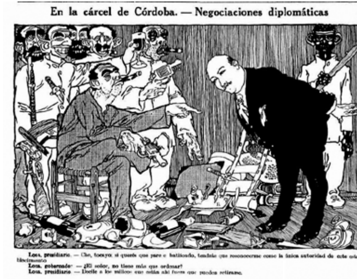
IMAGEN 1: “Caras y Caretas”, N°921, 27/05/1916. 13

Con Amaya destituido, se produjo el cese del motín. Uno de los lugares más afectados fue el museo penitenciario (imagen 2), de donde los presos sustrajeron las armas. Los únicos sectores que resultaron sin daños fueron la capilla y el taller de carpintería.