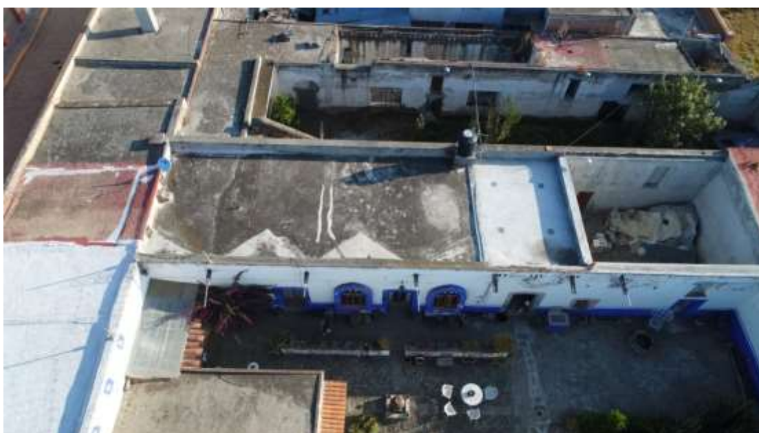
Imagen 3. Ex hacienda de Tlacotla y Vivienda de María de los Ángeles Grant Munive, 2020