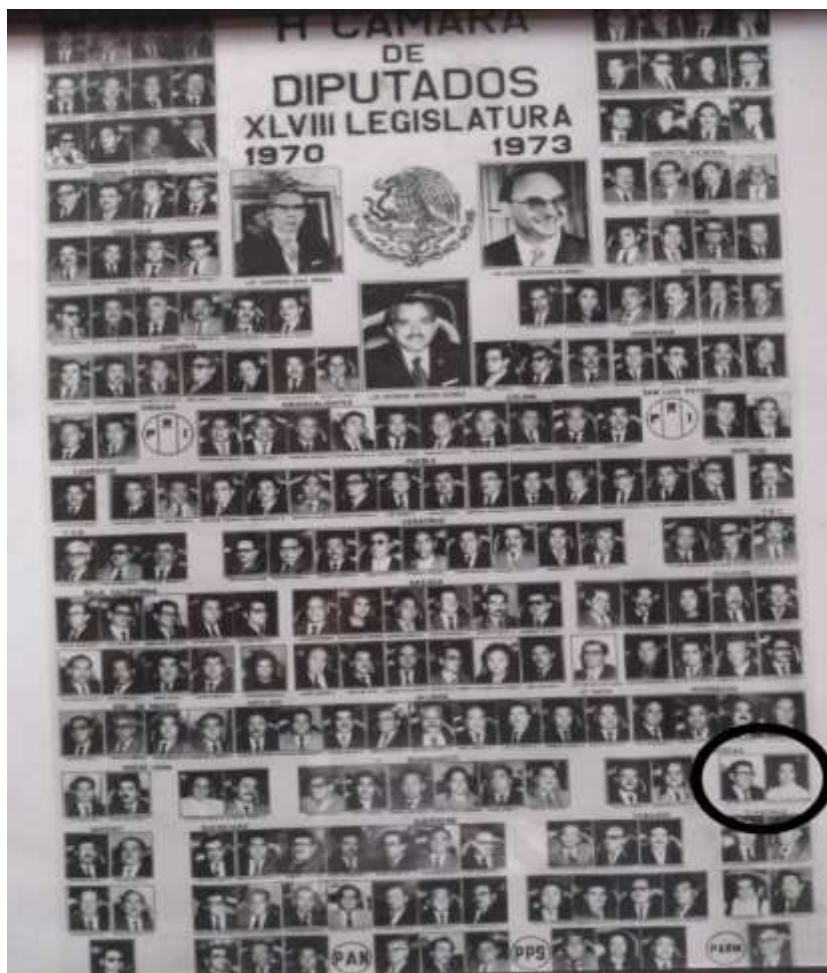
Imagen 4. Honorable Cámara de Diputados, XLVIII Legislatura 1970-1973.